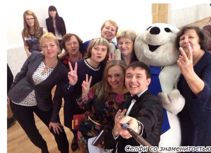
Селфи со знаменитостью