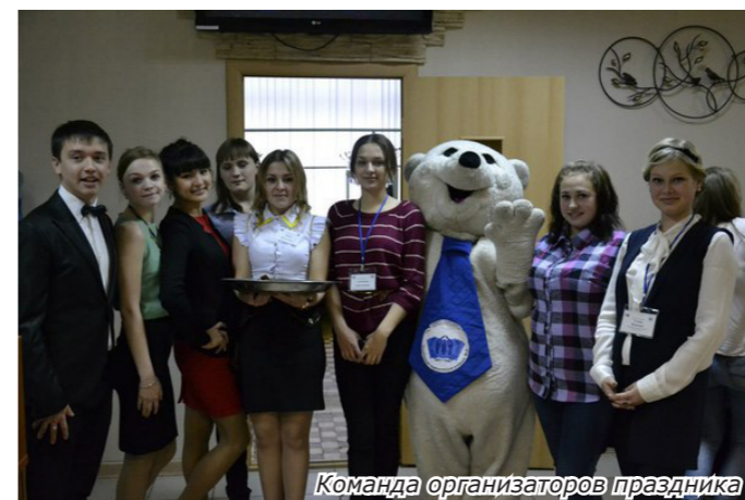
Команда организаторов праздника