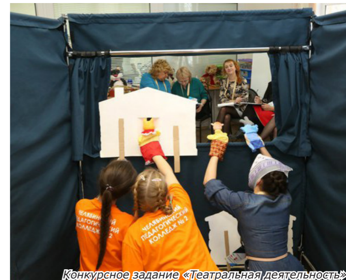
Конкурсное задание «Театральная деятельность»

Russia – Челябинск – 2015»? – Я делала, что могла, и как могла, прилагая все усилия, используя те умения, знания и навыки, которые приобрела за 4 года учебы в ЧПК №2, и видимо, у меня это получилось немного лучше, чем у соперников. Также, хочу выразить огромную благодарность своим наставникам. Нас обучают очень сильные преподаватели, которые всегда поддержат и придут на помощь в нужную минуту, без них я бы не достигла таких высоких результатов. – Какой этап конкурса оказался для тебя наиболее сложным? Какие моменты конкурса тебе запомнились? – Любый конкурс – это трудность, которую необходимо преодолеть. Непростыми были не только задания, но и сама атмосфера. Было