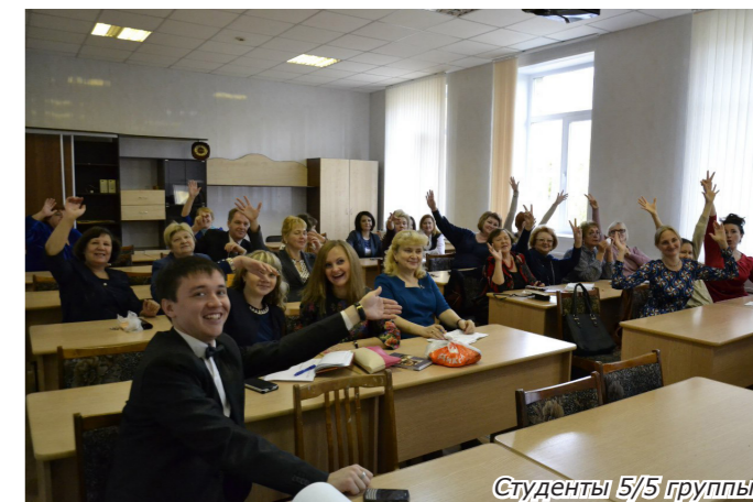
Студенты 5/5 группы