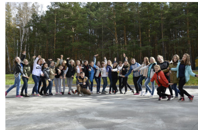
Игра «Японский театр»