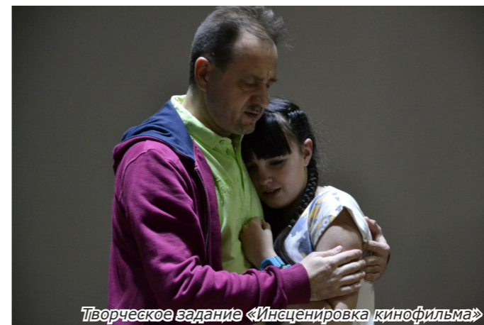
Творческое задание «Инсценировка кинофильма»