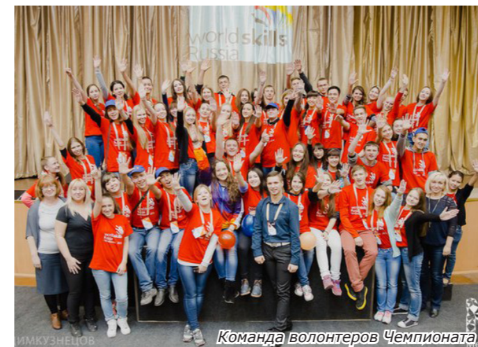
Команда волонтеров Чемпионата