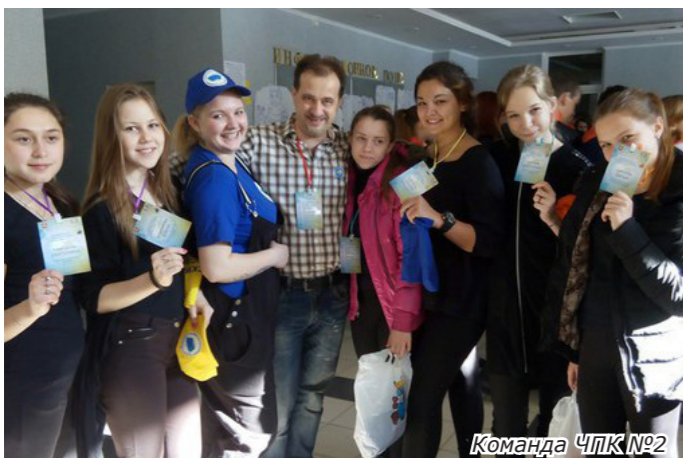
Команда ЧПК №2